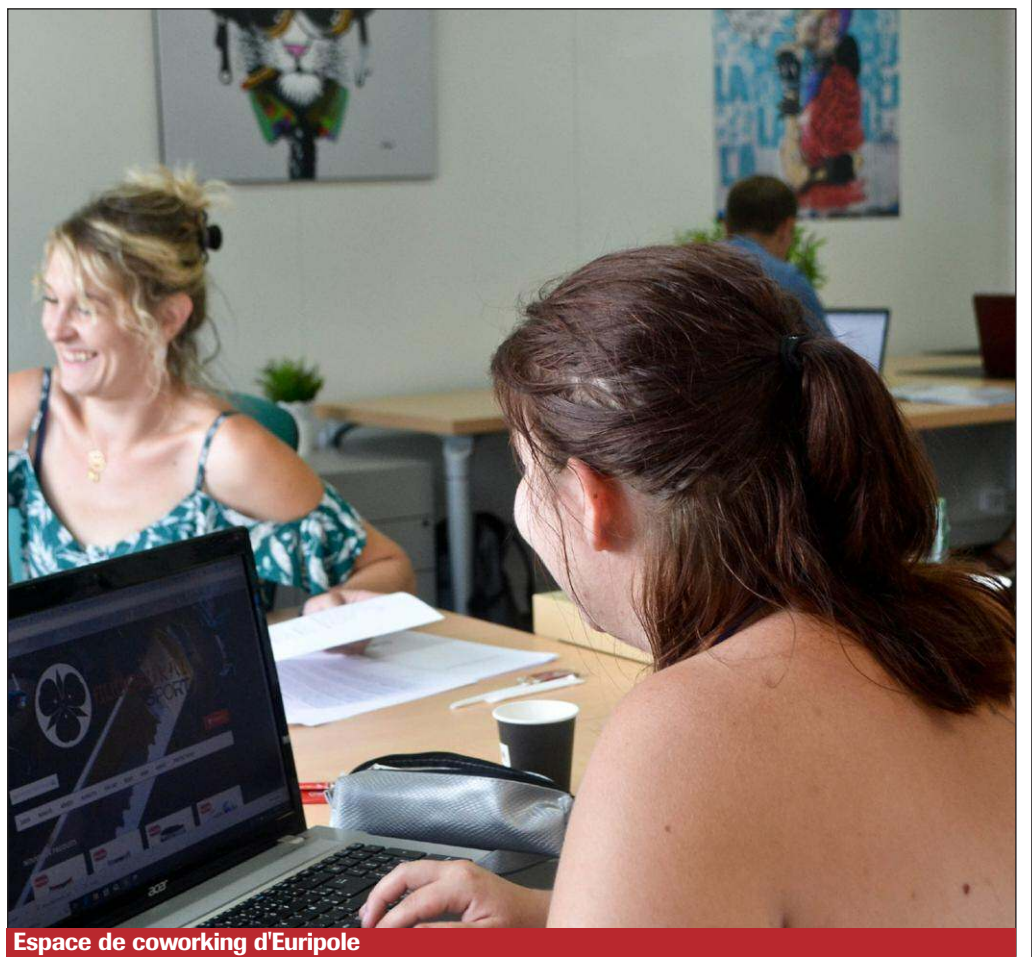
Espace de coworking d'Euripole